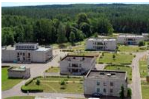
ДОЛ «Изумрудный» с высоты птичьего полета

Лагерь расположен в 4 км. от д. Прошково, где есть фельдшерско-акушерский пункт, железнодорожная станция. Расстояние между лагерем и г. Новополоцком 70 километров, до районного центра г. Глубокое 35 км.